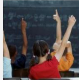
Τα παιδιά μας λιποθυμούν στα σχολεία από την ασιτία το 2011

Μετά την Αθήνα και τη Θεσσαλονίκη, λοιπόν, οι "μέρες της πείνας" έχουν έρθει και στην Κρήτη. Η χθεσινή αποκάλυψη, για παιδί που λιποθύμησε στο σχολείο του, σκάρει την κοινή γνώμη του νησιού.. Το απίστευτο αυτό κρούσμα παρουσιάστηκε σε σχολικό συγκρότημα των δυτικών συνοικιών στο Ηράκλειο και δε φαίνεται να είναι το μόνο, αφού ολοένα και περισσότερες οικογένειες μένουν χωρίς δουλειά και αδυνατούν να εξασφαλίσουν ακόμα και το καθημερινό κολατσιό του σχολείου για τα παιδιά τους!